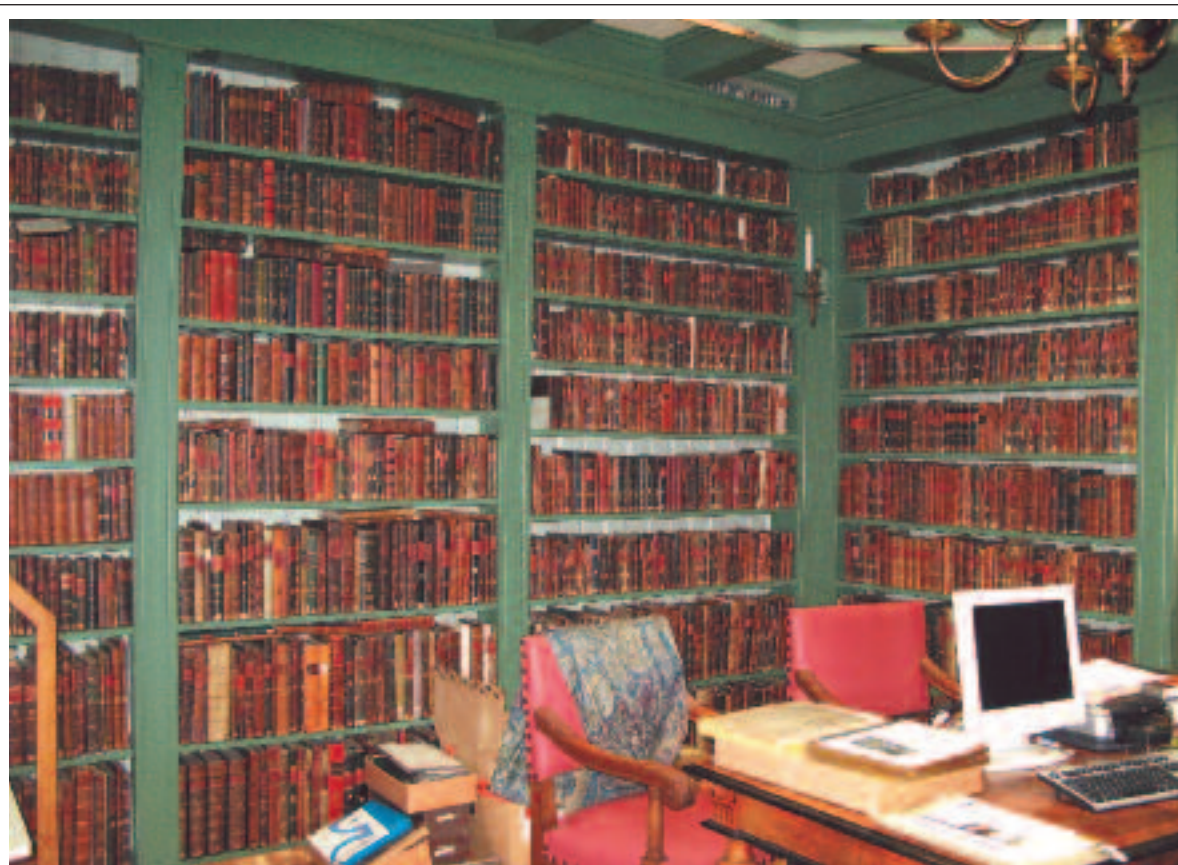
La bibliothèque Ets Haim – Livraria Montezinos est la plus ancienne bibliothèque juive au monde et elle est régulièrement consultée.

ticulier, d'un manuscrit ou d'un incunable. Avant de parler du contenu fabuleux de cette collection, il faut rappeler qu'elle a été volée par les Allemands pendant la guerre, retrouvée par les forces américaines et ramenée à Amsterdam pour