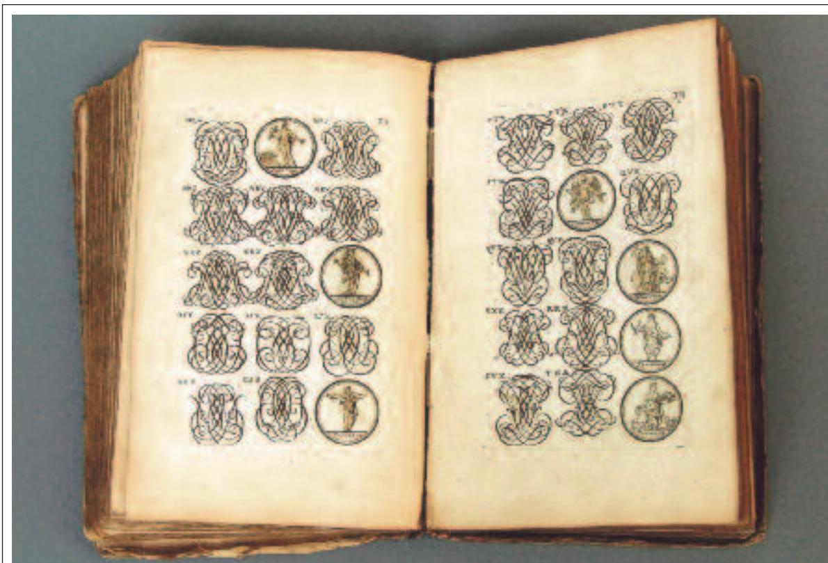
Catalogue d'emblèmes, de devises, d'armoiries et de monogrammes datant de 1696 de Jean Jombert. Les familles séfarades avaient des armoiries, même lorsqu'elles n'étaient pas aristocratiques. De plus, suite à leur conversion, de nombreux Juifs étaient adoptés par des familles aristocratiques en Espagne et avaient le droit d'utiliser leurs armoiries.