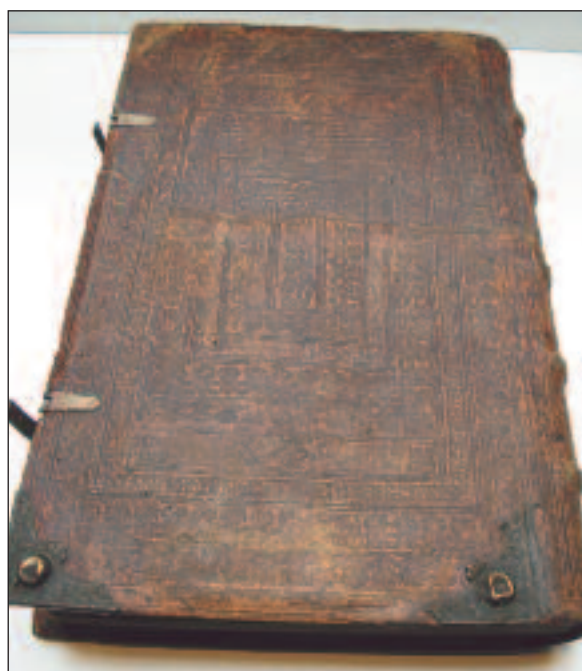
La bibliothèque détient une grande collection de livres dotés de magnifiques reliures anciennes.

la synagogue ou l'avènement d'un nouveau roi, constituaient aussi des occasions pour faire des