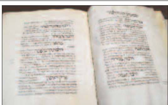
Le plus ancien manuscrit de la bibliothèque date de 1282. Il s'agit d'une copie d'un Mishné Torah de Maimonide fait à Narbonne par un copieur resté anonyme.

ticulier, d'un manuscrit ou d'un incunable. Avant de parler du contenu fabuleux de cette collection, il faut rappeler qu'elle a été volée par les Allemands pendant la guerre, retrouvée par les forces américaines et ramenée à Amsterdam pour